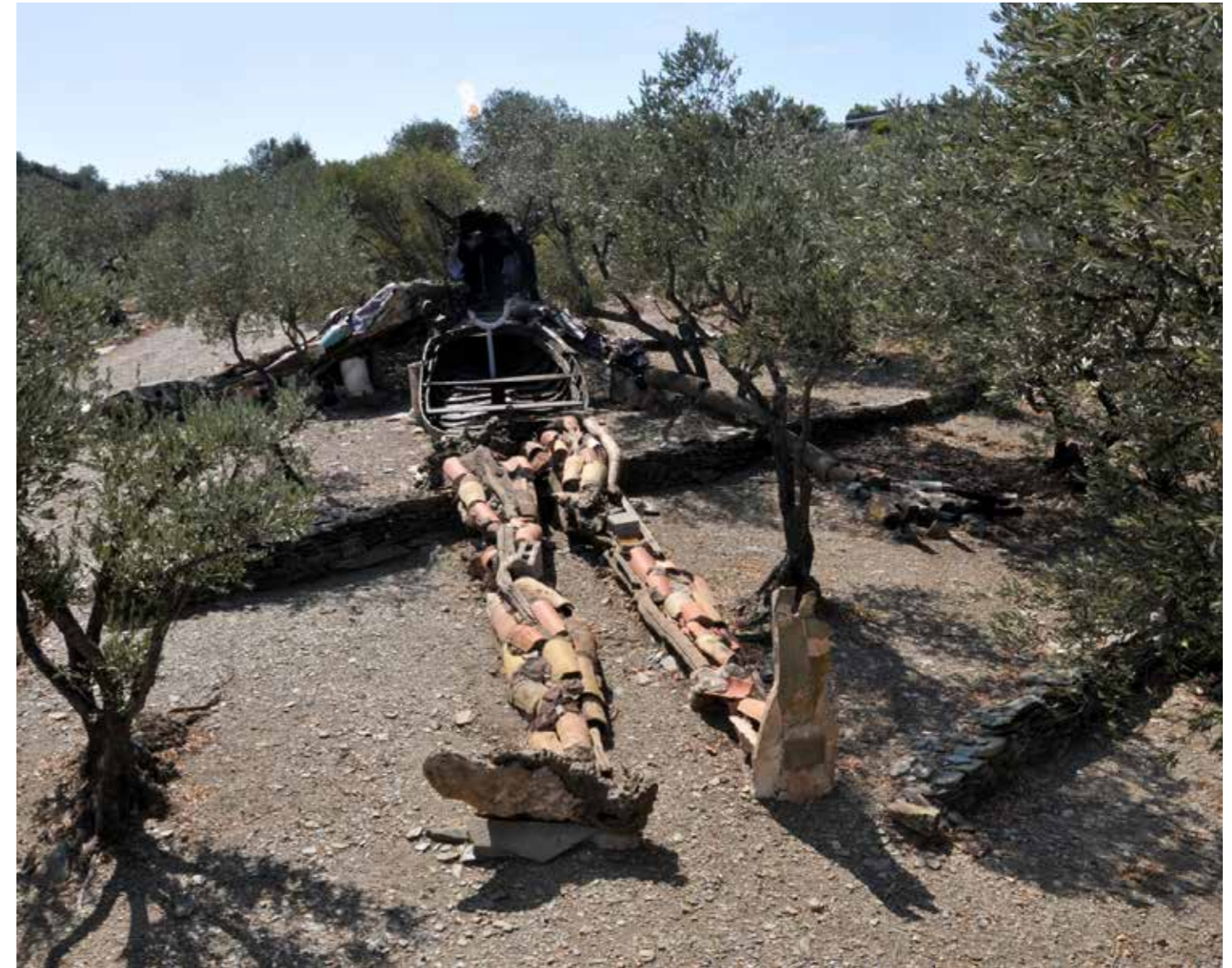
El Crist de les Escombraries