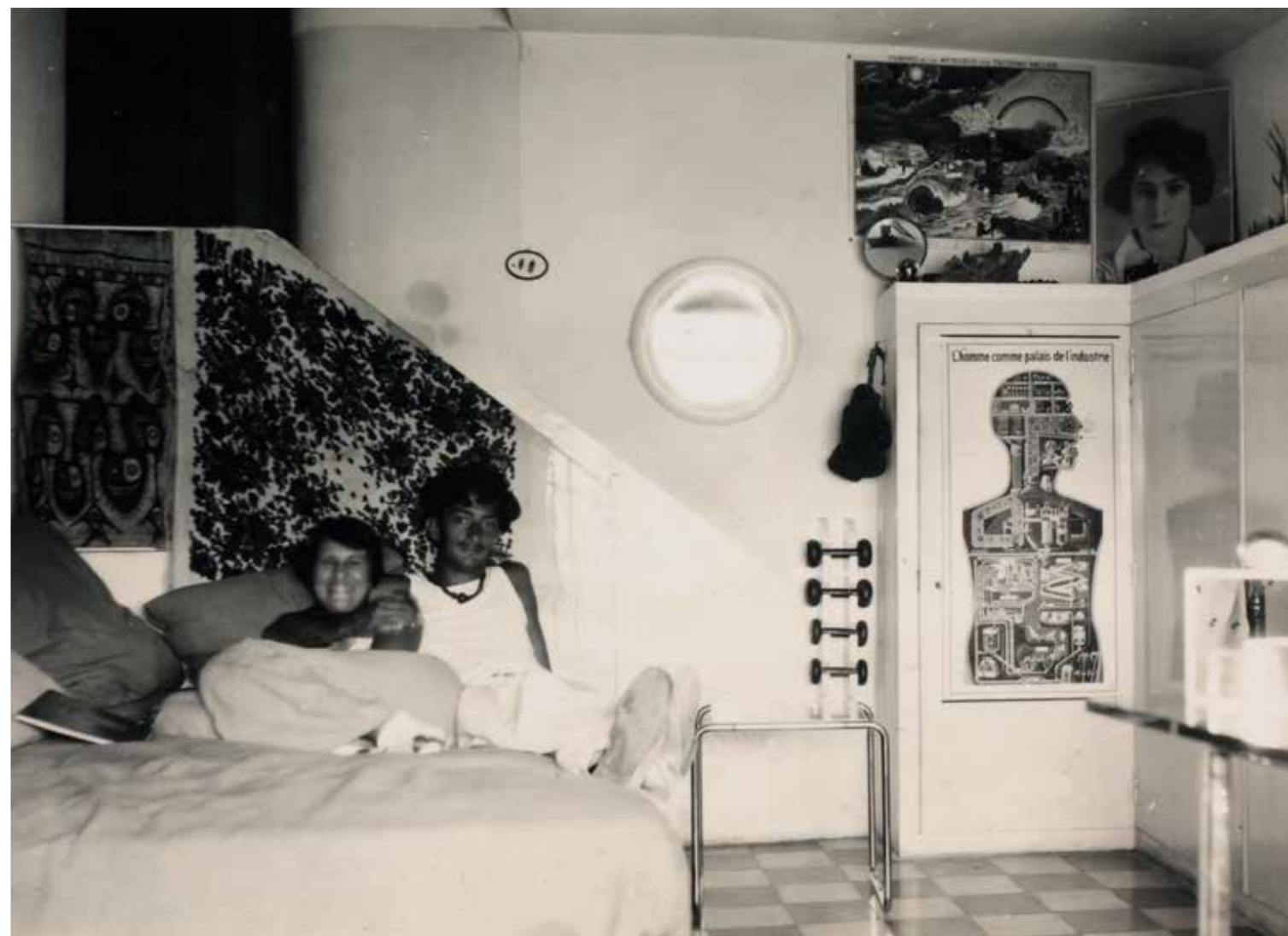
Gala i Dalí a l'interior de Portlligat, 1931

Una de les principals línies d'investigació de la Fundació Dalí és l'estudi dels materials artístics. Dels diversos utensilis localitzats al taller i al magatzem de pintures adjacent se n'analitza l'estat de conservació, se'ls identifica i cataloga. El resultat d'aquest estudi progressiu permet avançar en el coneixement de l'obra daliniana des de la vessant tècnica, no tan sols respecte a la col·lecció pròpia de la Fundació Dalí sinó que també ajuda a determinar l'autoria de les obres i l'atribució de les quals és qüestionada. Els estudis ens parlen de procediments, recursos i tècniques, de la tipologia dels diferents estris, dels quals se n'identifiquen les marques comercials, els períodes de fabricació i possible compra per part de l'artista. En definitiva, aporten un corpus d'informació que aprofundeix en el coneixement de l'actitud de l'artista davant del cavallet.