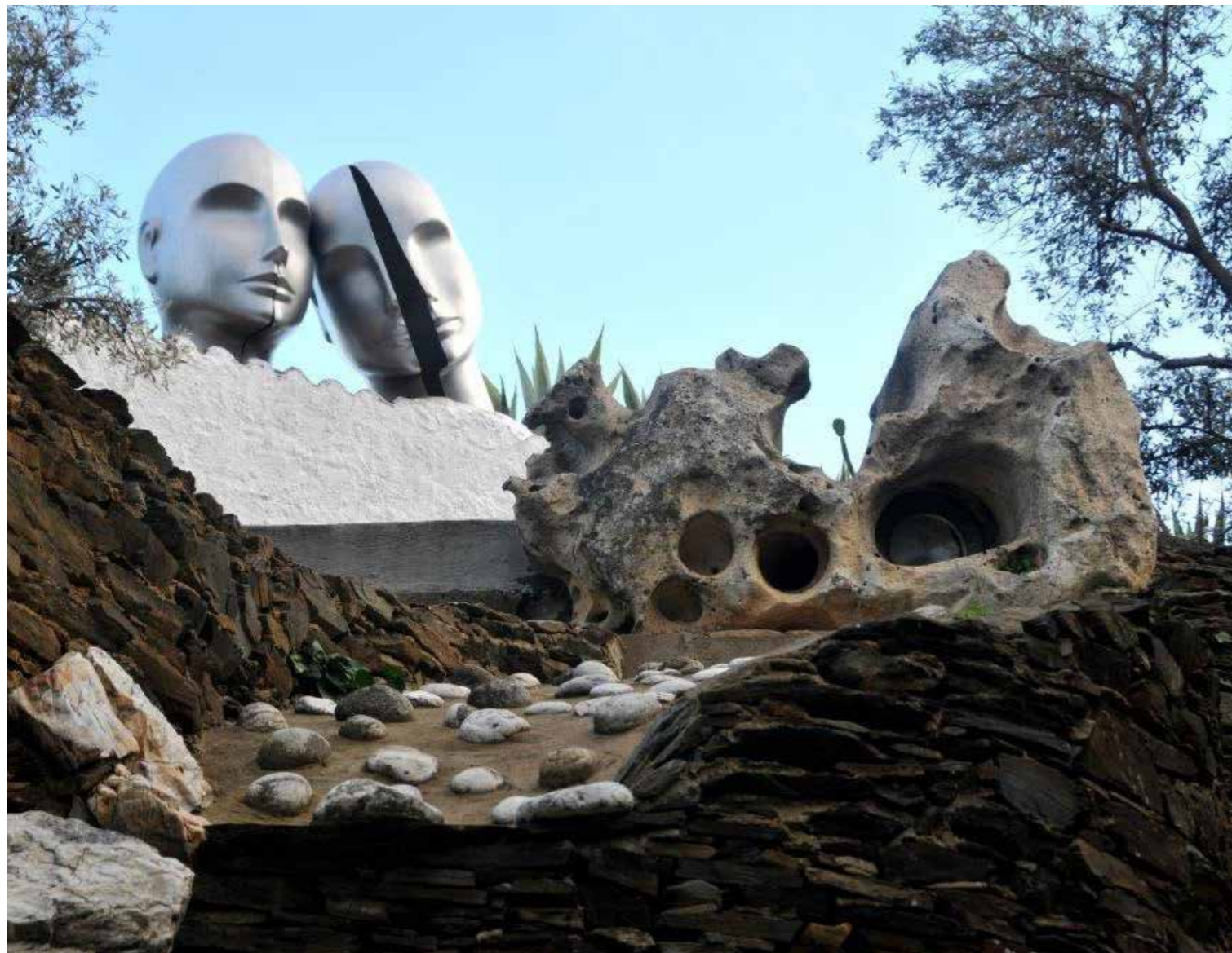
Càstor i Pòl·lux

Mobiliari: des de mobles antics (del segle XVII en endavant) fins a mobles funcionals del segle XX o peces dissenyades per Dalí com l'icònic sofà-llavis