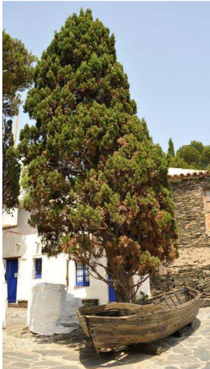
Pou, barca i xiprer davant de la Casa de Portlligat

Les reformes i ampliacions successives de la construcció primigènia tenen per objecte satisfer les necessitats creatives de Salvador Dalí. Així, aconseguix un espai diàfan on la llum natural entra i on el paisatge de la badia de Portlligat i l'Illa de Sa Farnera penetren a l'interior de la cambra.