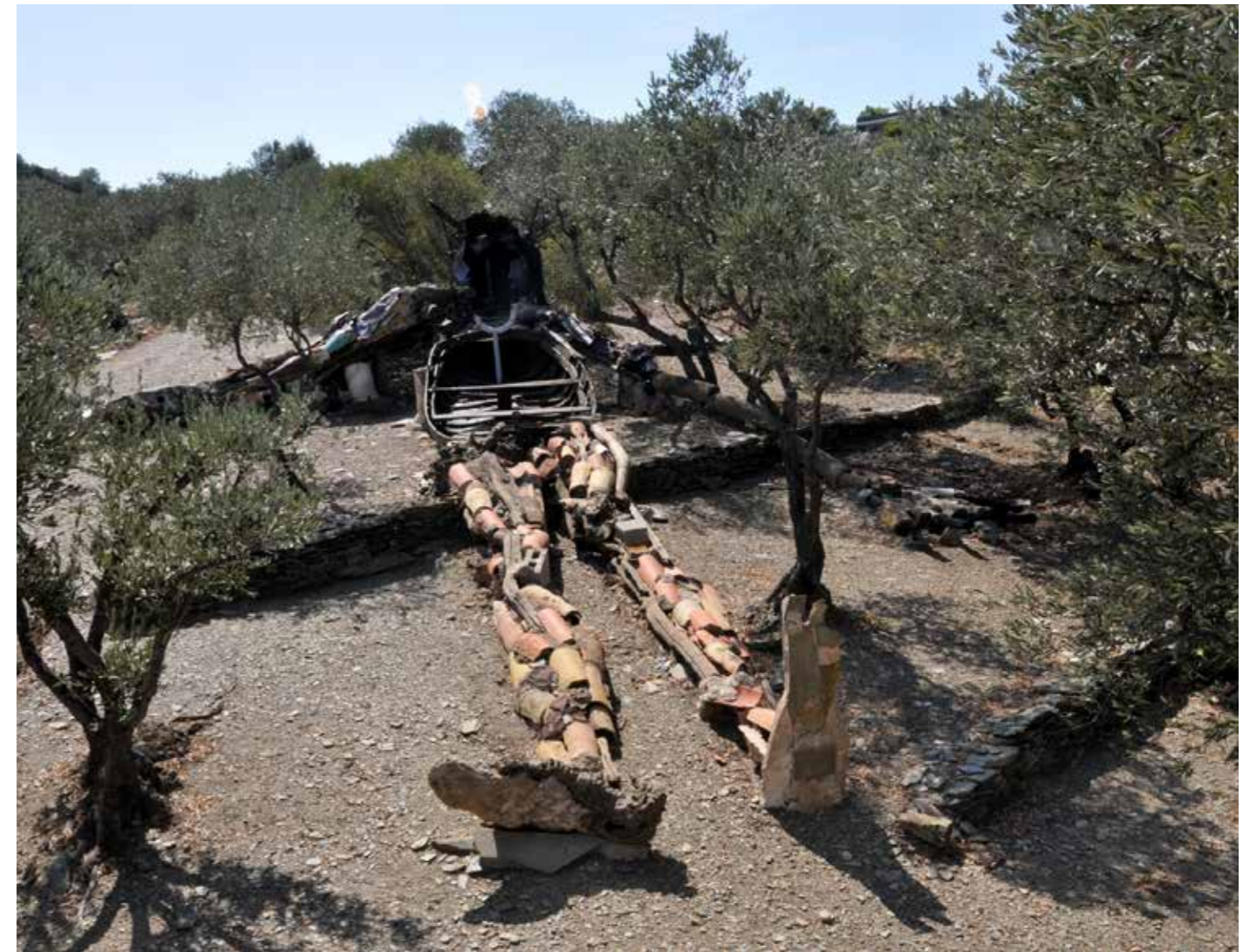
El Cristo de los Escombros