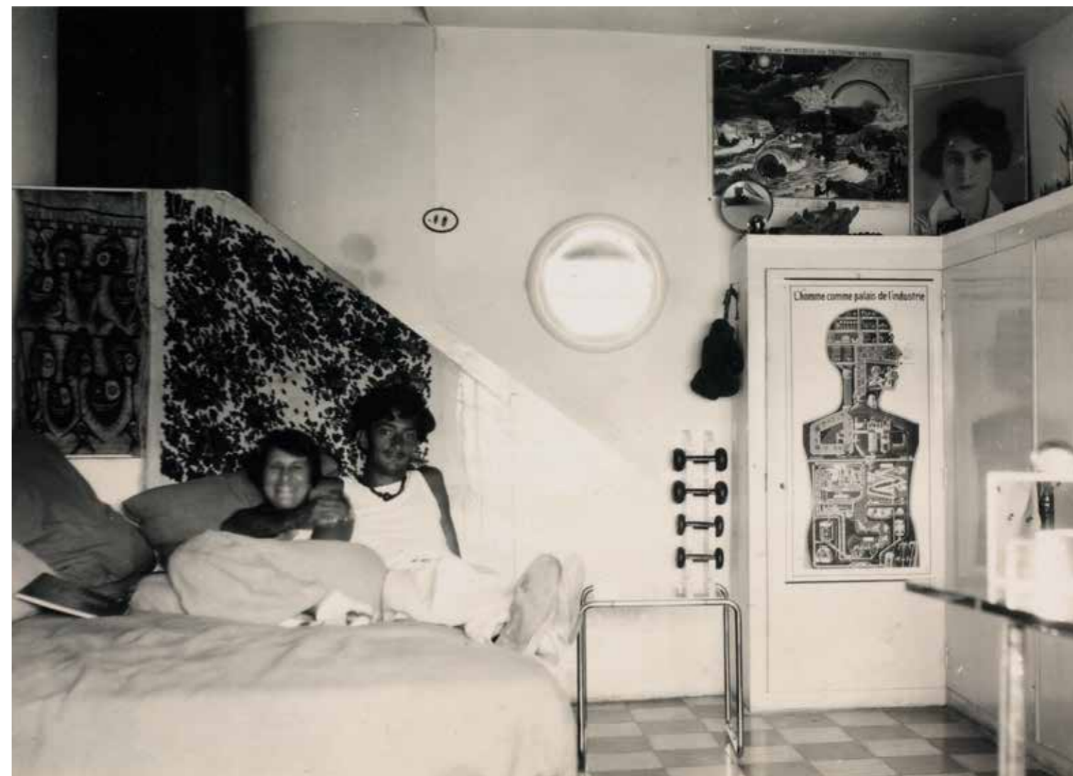
Gala y Dalí en el interior de Portlligat, 1931

Una de las principales líneas de investigación de la Fundación Dalí es el estudio de los materiales artísticos. De los diversos utensilios localizados en el taller y en el almacén de pinturas adyacente se analiza su estado de conservación, se identifican y catalogan. El resultado de este estudio progresivo permite avanzar en el conocimiento de la obra daliniana desde la vertiente técnica, no tan solo respecto a la colección propia de la Fundación Dalí sino que también ayuda a determinar la autoría de las obras cuya atribución se cuestiona. Los estudios nos hablan de procedimientos, recursos y técnicas, de la tipología de los distintos utensilios, de los cuales se identifican las marcas comerciales, los períodos de fabricación y posible compra por parte del artista. En definitiva, aportan un corpus de información que profundiza en el conocimiento de la actitud del artista ante el caballete.