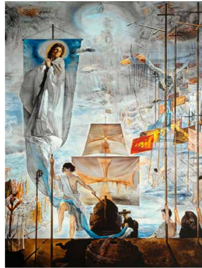
El descubrimiento de América , 1958