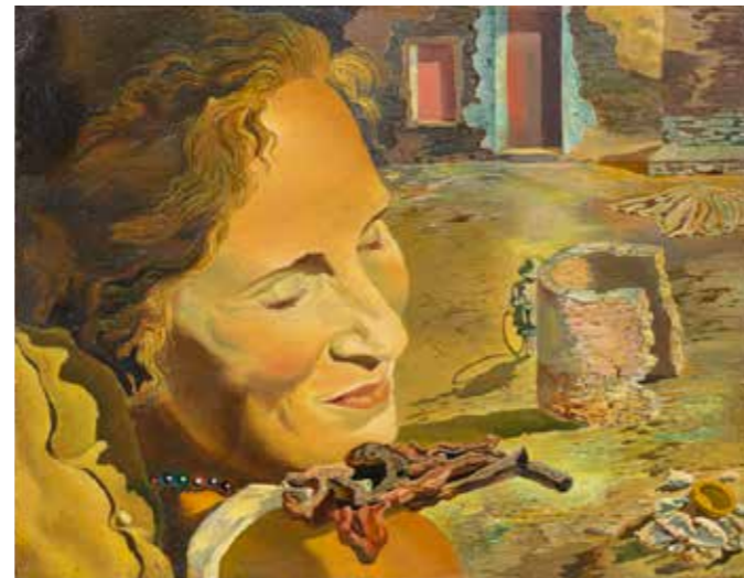
Retrato de Gala con dos costillas en equilibrio sobre su hombro , c. 1934