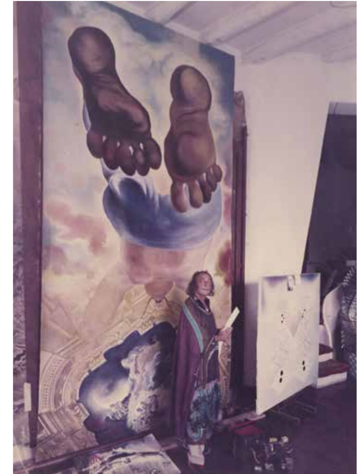
Salvador Dalí en el taller de Portlligat. c. 1970

También obras icónicas de los años cincuenta y sesenta como El Cristo , Asunta corpuscularia lapislazulina o telas de grandes dimensiones como La batalla de Tetuán , La Pesca de Atún o El descubrimiento de América . Es en Portlligat donde se conciben los grandes proyectos del Teatro-Museo Dalí y del Castillo dedicado a Gala. Portlligat se convierte en el centro creativo por excelencia de Salvador Dalí. Figueras, Púbol, los hoteles Sant Regis de Nova York, Meurice de París o Del Monte Lodge de Monterrey (California) son talleres efímeros, anillos que giran en torno a Portlligat.