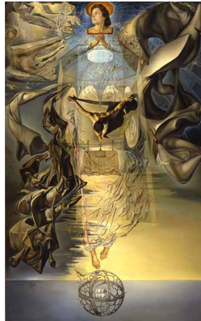
Asunta corpuscularia lapislazulina , 1952

También obras icónicas de los años cincuenta y sesenta como El Cristo , Asunta corpuscularia lapislazulina o telas de grandes dimensiones como La batalla de Tetuán , La Pesca de Atún o El descubrimiento de América . Es en Portlligat donde se conciben los grandes proyectos del Teatro-Museo Dalí y del Castillo dedicado a Gala. Portlligat se convierte en el centro creativo por excelencia de Salvador Dalí. Figueras, Púbol, los hoteles Sant Regis de Nova York, Meurice de París o Del Monte Lodge de Monterrey (California) son talleres efímeros, anillos que giran en torno a Portlligat.