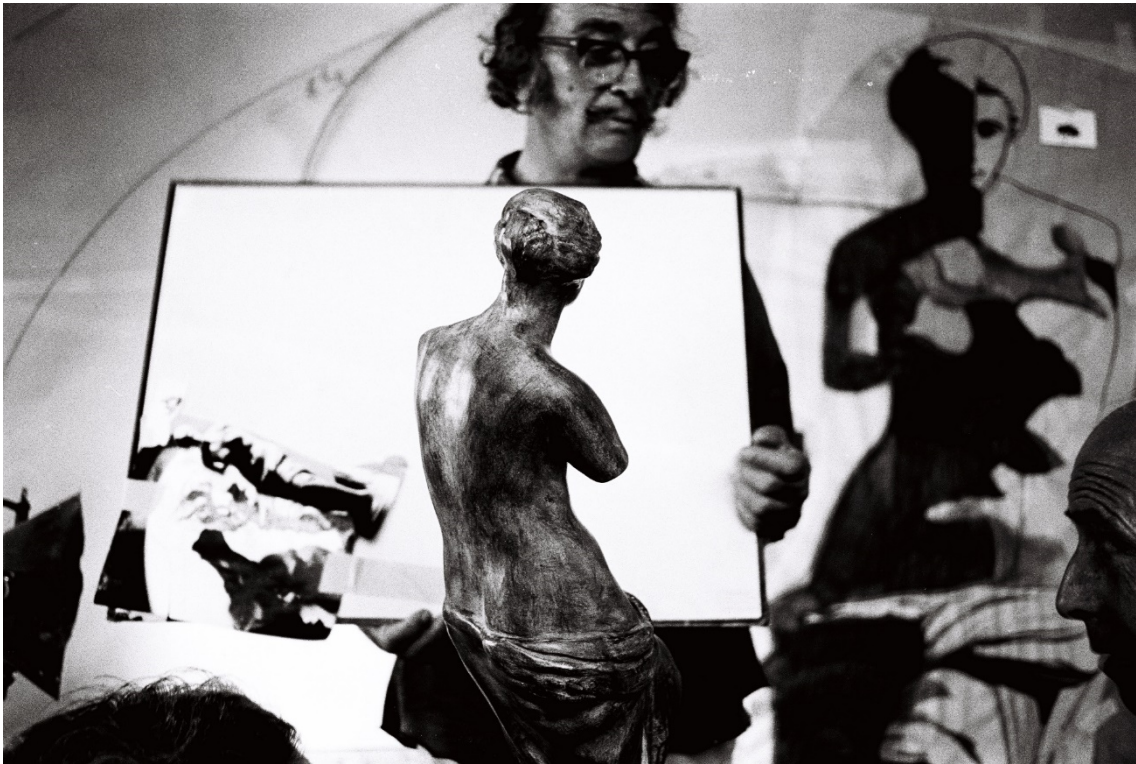
Salvador Dalí al seu taller de Portlligat, 1968.