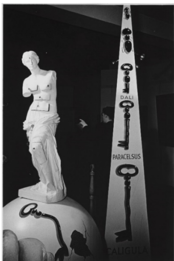
Instal·lació amb la Venus de Milo amb calaixos a l'exposició Salvador Dalí 1939 , galeria Julien Levy de Nova York

Venus de Milo amb calaixos és una escultura de guix de 1936 que rememora, a escala reduïda, l'obra original conservada al Musée du Louvre de París des de 1821. Dalí transgredeix el referent clàssic perforant el cos de la Venus amb sis calaixos, elements que, segons Dalí, només es poden comprendre a través de la psicoanàlisi: "l'única diferència entre la Grècia immortal i l'època contemporània és Sigmund Freud, que ha descobert que el cos humà, que era purament neoplatònic a l'època dels grecs, avui és ple de calaixos secrets que només la psicoanàlisi és capaç de desvetllar". "¿És possible que el seu desig de transgressió respongui a la voluntat d'acomodar l'ideal del món clàssic a la realitat del present, ergo als anys trenta del segle XX?