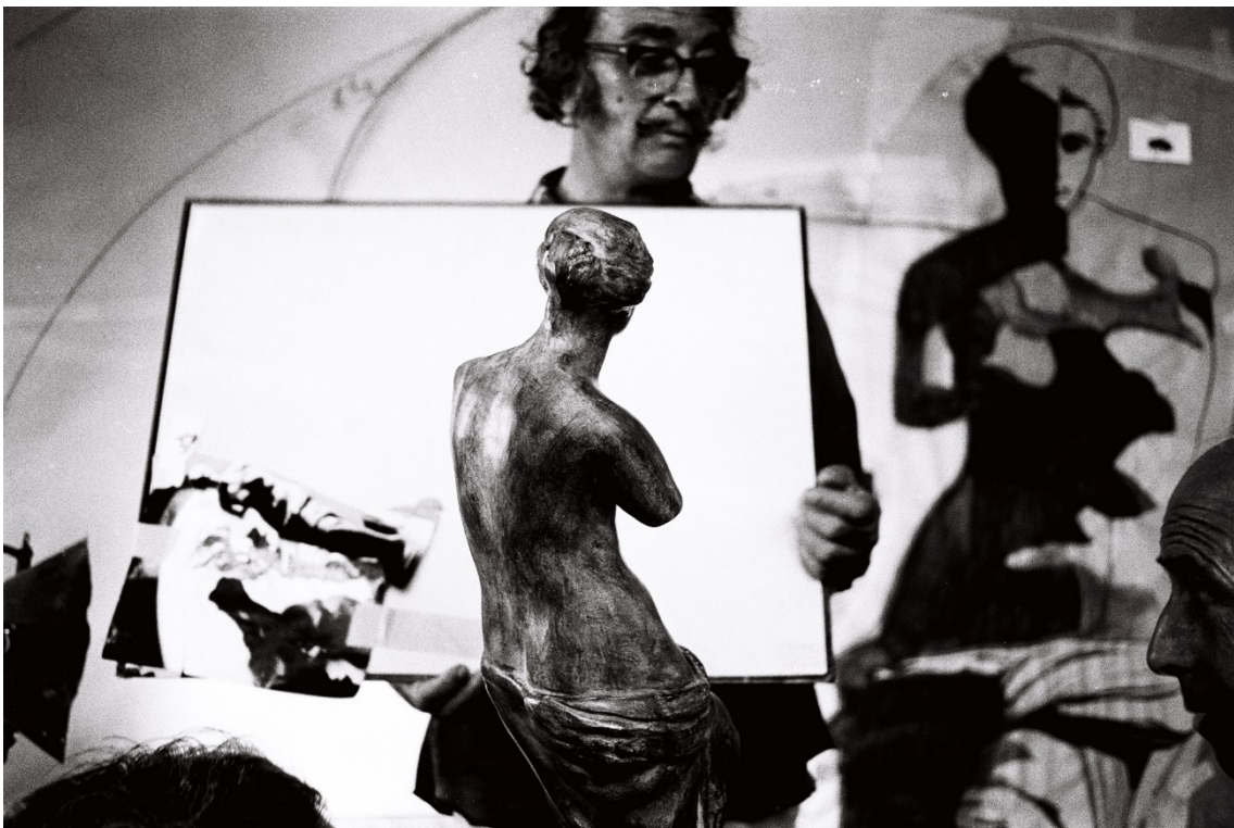
Salvador Dalí en su taller de Portlligat, 1968. Derechos de imagen de Salvador Dalí reservados