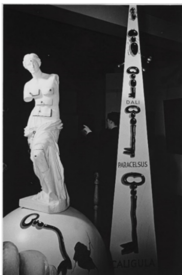
Instalación de la Venus de Milo con cajones en la exposición Salvador Dalí 1939 , galería Julien Levy de Nueva York

Venus de Milo con cajones es una escultura de yeso de 1936 que rememora, a escala reducida, la obra original conservada en el Musée du Louvre de París desde 1821. Dalí transgrede el referente clásico perforando el cuerpo de la Venus con seis cajones, elementos que, según Dalí, sólo pueden comprenderse a través del psicoanálisis: “Porque la única diferencia entre la Grecia inmortal y la época contemporánea es Sigmund Freud, que ha descubierto que el cuerpo humano, que en la época de los griegos era puramente neoplatónico, hoy en día está lleno de cajones secretos que solo el psicoanálisis es capaz de revelar”. ¿Es posible que su deseo de transgresión responda a la voluntad de acomodar el ideal del mundo clásico a la realidad del presente, ergo a los años treinta del s. XX?