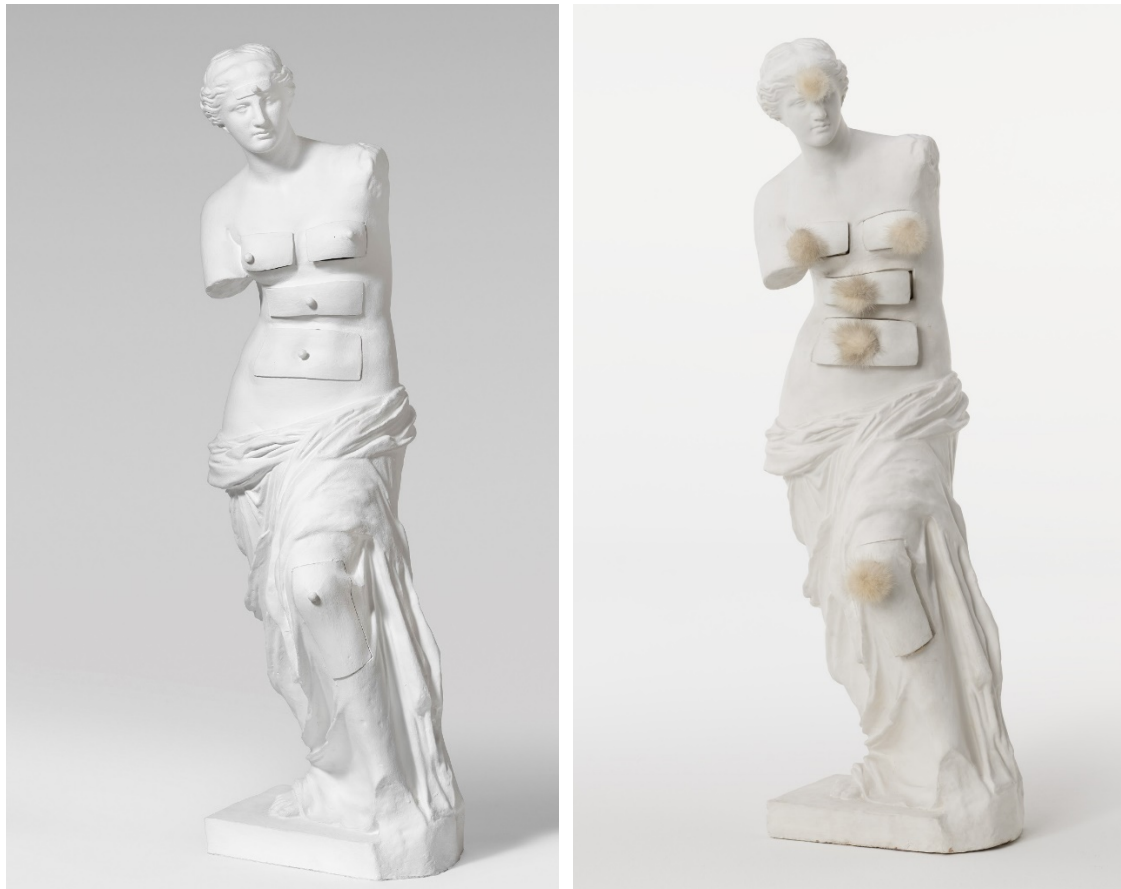
Izda. La Venus de Milo con cajones (1964), de Figueres, en diálogo con su homónima americana de 1936. De la obra: © Salvador Dalí, Fundació Gala-Salvador Dalí/VEGAP, Figueres, 2022.

El ejemplar de bronce de la Venus de Milo con cajones que pertenece a la Fundación Dalí se expone dentro de una vitrina de cristal en diálogo con su homónima americana, ésta última en forma de creación holográfica que se muestra gracias a la tecnología emergente OLED transparente. Este tipo de pantalla permite mostrar imágenes de tipo holográfico en alta definición, brillo y contraste. El dispositivo de la exposición es una de las primeras unidades de esta tecnología pionera, que se prevé que evolucione exponencialmente en un futuro próximo. Las imágenes de alta resolución han sido cedidas por el Art Institute of Chicago, la técnica holográfica ha sido realizada por tururut Art Infogràfic y la pantalla OLED la aporta la empresa LG.