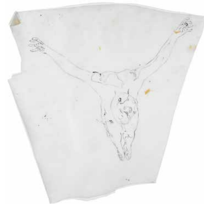
Lámina plástica (celofán) con la imagen de la fotografía calcada directamente con tinta negra

Dalí suele utilizar como modelos objetos y personas muy cercanas, físicamente y afectivamente. Así, en algunas de sus obras reconocemos a personajes de Cadaqués, a menudo pescadores. En el caso de El Cristo , el paisaje se completa con una escena habitual de la bahía: unos pescadores trabajando a la orilla del mar. No obstante, para esta tela, Dalí imagina unas figuras de ascendencia muy concreta: «También había tenido, de entrada, la tentación de tomar como modelo para el fondo a los pescadores de Portlligat, pero en este sueño, en el sitio de los pescadores de Portlligat, aparecía, en un barco, un personaje de campesino francés pintado por Le Nain, de quien solo su rostro había cambiado para parecerse a un pescador de Portlligat. El pescador, visto de espaldas, tenía, sin embargo, una silueta al estilo de Velázquez».