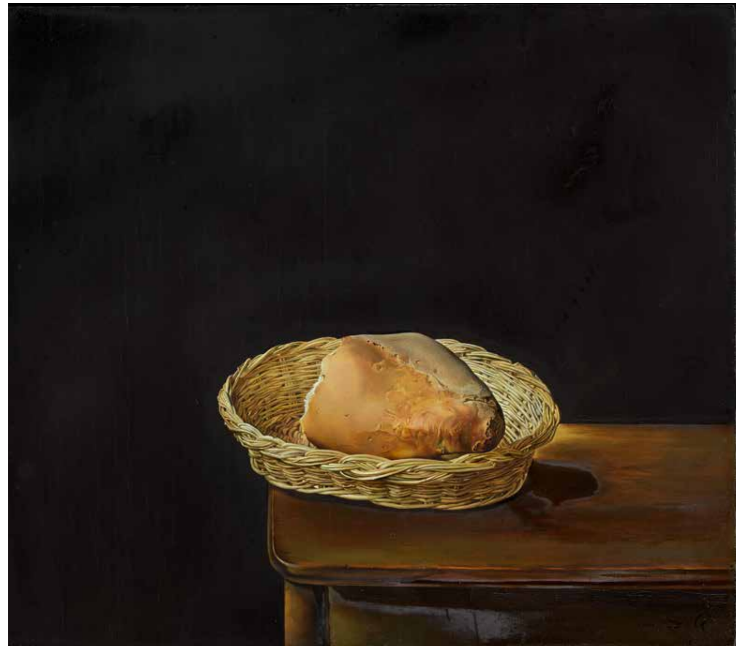
Salvador Dalí. La cesta de pan , 1945. Óleo sobre tablero de madera contraplacado, 33 x 38 cm © Salvador Dalí, Fundació Gala-Salvador Dalí, Figueres/VEGAP, 2023

Forma parte de la exposición material inédito que permite conocer el contexto de creación de El Cristo : cinco fotografías, seis piezas de material preparatorio y un cuaderno con estudios y esbozos ejecutados entre los años 1948-1958. Esta libreta se muestra en formato original y a través de un monitor. Destacan también dos audiovisuales de unos 6 minutos de duración que ponen el foco en la relevancia del contexto, proceso de creación y del paisaje.