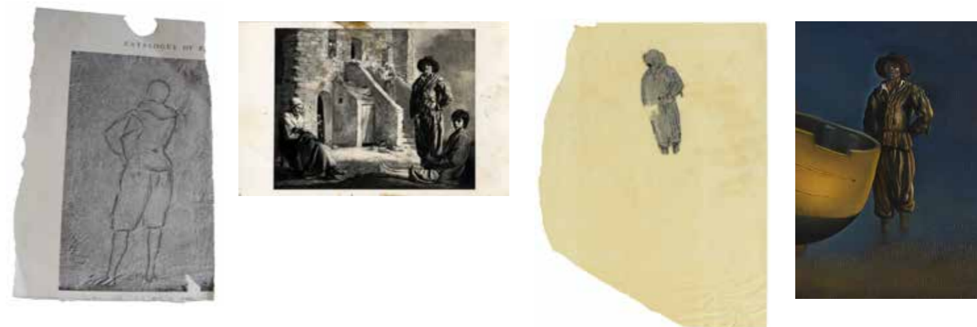
Hoja de libro con la reproducción del dibujo de Velázquez reseguído a lápiz Modelo para pescador. Postal de Paysans devant leur Maison , Louis Le Nain (c. 1641-1642) Calco a tinta negra de una figura de la pintura de Louis Le Nain, Paysans devant leur maison , de 1641 Detalle de la segunda figura del pescador de la obra El Cristo , 1951. © Salvador Dalí, Fundació Gala-Salvador Dalí, Figueres/VEGAP, 2023

Dalí suele utilizar como modelos objetos y personas muy cercanas, físicamente y afectivamente. Así, en algunas de sus obras reconocemos a personajes de Cadaqués, a menudo pescadores. En el caso de El Cristo , el paisaje se completa con una escena habitual de la bahía: unos pescadores trabajando a la orilla del mar. No obstante, para esta tela, Dalí imagina unas figuras de ascendencia muy concreta: «También había tenido, de entrada, la tentación de tomar como modelo para el fondo a los pescadores de Portlligat, pero en este sueño, en el sitio de los pescadores de Portlligat, aparecía, en un barco, un personaje de campesino francés pintado por Le Nain, de quien solo su rostro había cambiado para parecerse a un pescador de Portlligat. El pescador, visto de espaldas, tenía, sin embargo, una silueta al estilo de Velázquez».