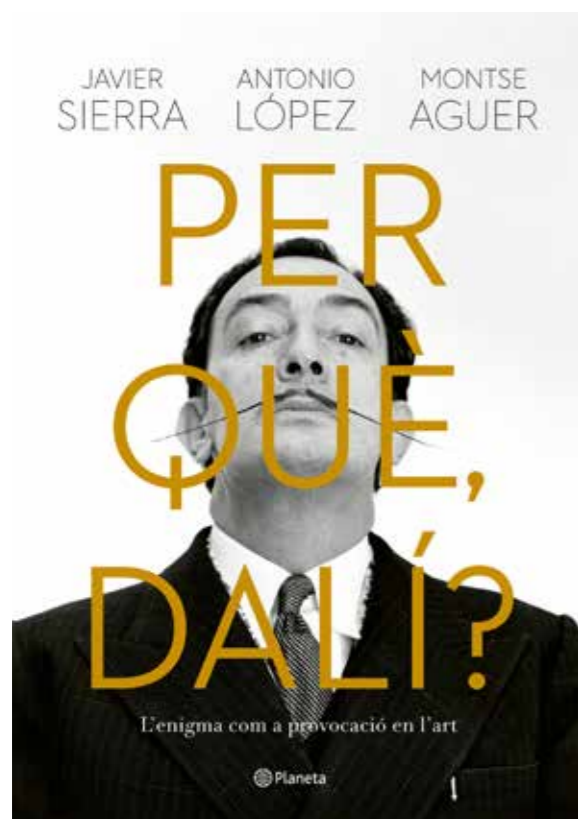
Cubierta del libro ¿Por qué, Dalí? editado por Planeta y la Fundación Dalí

Por su lado, Antonio López es uno de los pintores y escultores más relevantes del panorama artístico internacional. A lo largo de su trayectoria, ha recibido numerosos premios: Premio Príncipe de Asturias de las Artes y Premio Velázquez de Artes Plásticas. Su trayectoria, desde los años sesenta, está llena de numerosas exposiciones colectivas e individuales dentro y fuera de España. Siempre ha considerado a Dalí como una de las figuras más interesantes e influyentes del arte figurativo contemporáneo.