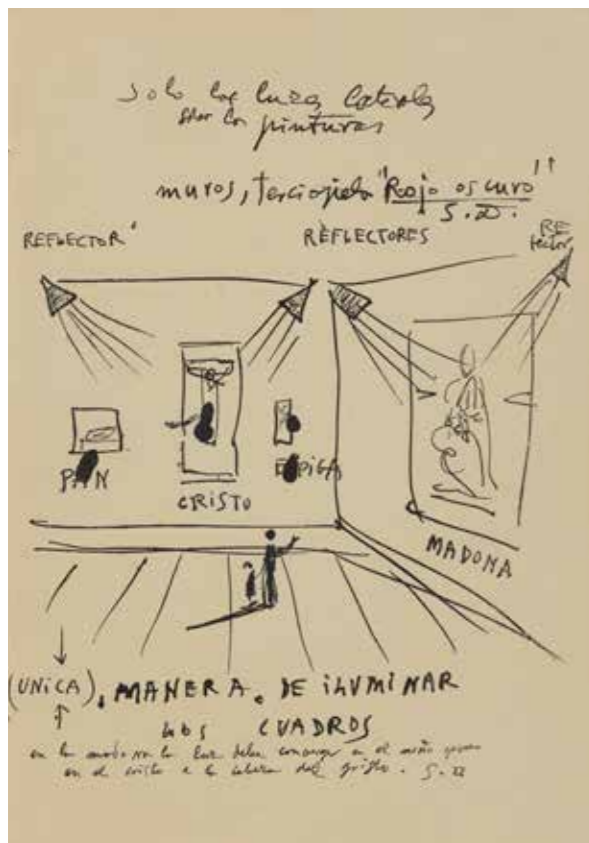
Carta de Salvador Dalí con instrucciones sobre el montaje en la I Bienal Hispanoamericana de Arte, 1952. El artista acompaña El Cristo con La cesta de pan (1945), San Jorge, el matador de dragones ( La espiga de trigo , 1947) y La Madona de Portlligat (c. 1950)