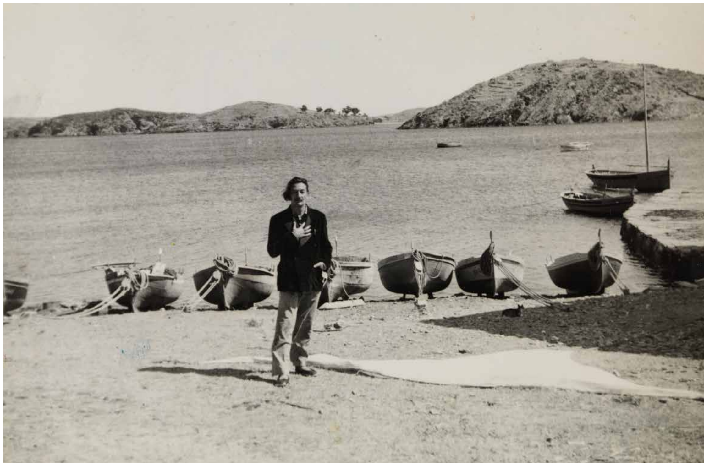
Salvador Dalí en la playa de Portlligat, 1954