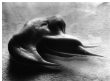
© Salvador Dalí, Fundació Gala-Salvador Dalí, VEGAP, Figueres, 2019