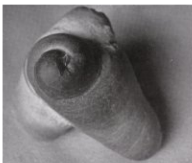
© Salvador Dalí, Fundació Gala-Salvador Dalí, VEGAP, Figueres, 2019