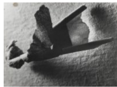
© Salvador Dalí, Fundació Gala-Salvador Dalí, VEGAP, Figueres, 2019