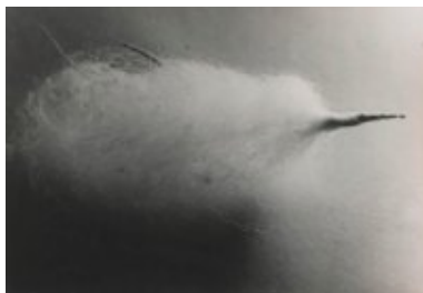
© Salvador Dalí, Fundació Gala-Salvador Dalí, VEGAP, Figueres, 2019 Brassai © Estate Brassai-RMN-Grand Palais

http://hemeroteca.lavanguardia.com/edition.html?edition=Sup.%20Cultura%20Cat&bd=02&bm=04&by=2016&ed=02&em=04&ey=2016&page=4