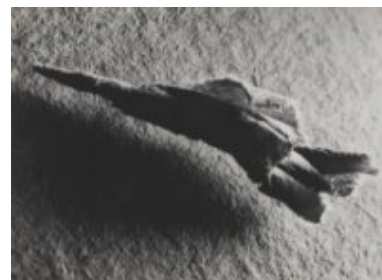
© Salvador Dalí, Fundació Gala-Salvador Dalí, VEGAP, Figueres, 2019 Brassai