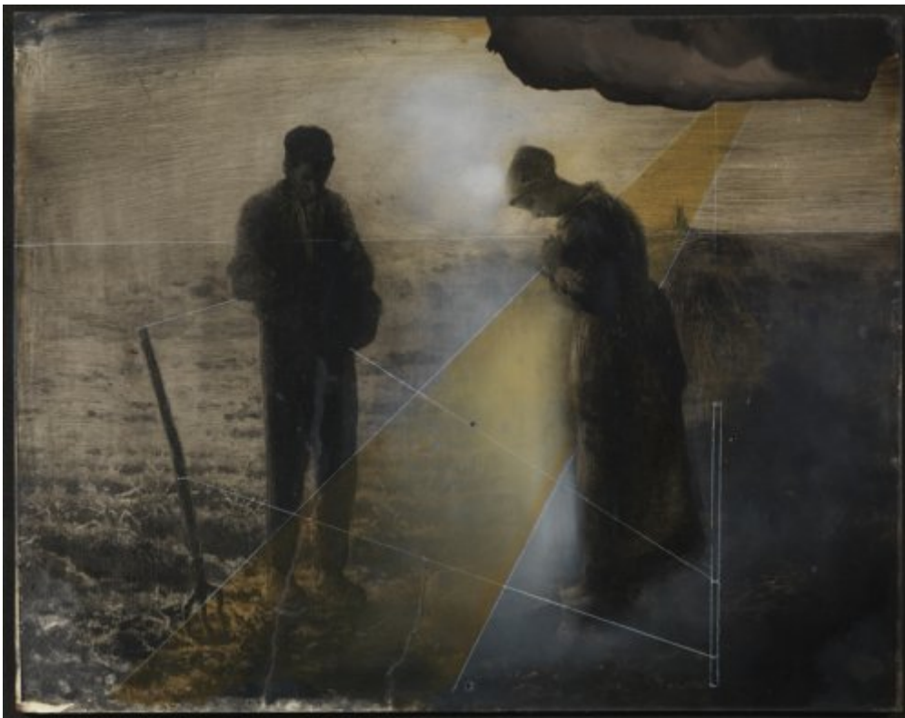
© Salvador Dalí, Fundació Gala-Salvador Dalí, Figueres, 2017