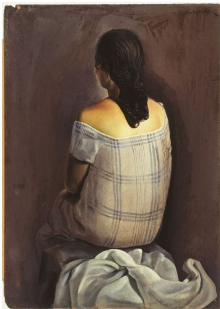
© Salvador Dalí, Fundació Gala-Salvador Dalí, Figueres, 2017