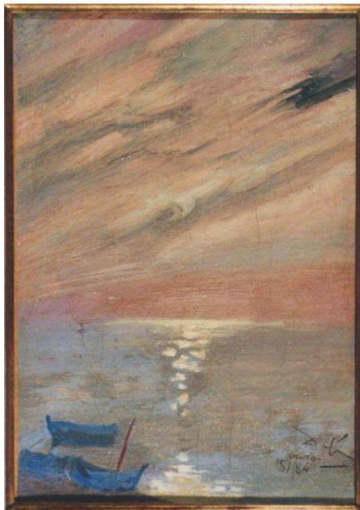
© Salvador Dalí, Fundació Gala-Salvador Dalí, Figueres, 2004