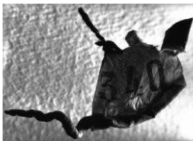
© Salvador Dalí, Fundació Gala-Salvador Dalí, VEGAP, Figueres, 2019 © Estate Brassai Succession - Philippe Ribeyrolles