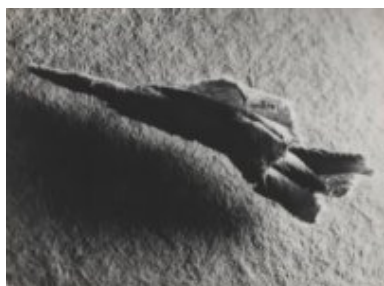
© Salvador Dalí, Fundació Gala-Salvador Dalí, VEGAP, Figueres, 2019