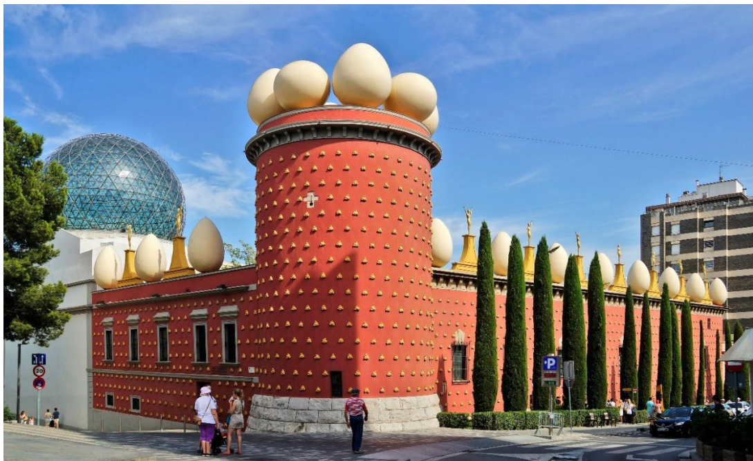
Torre Galatea. Siège de la Fondation Dalí. Figueres