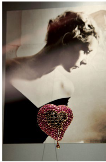
L'espace annexe Dalí·Bijoux

« Sans un public, sans la présence de spectateurs, ces bijoux n'accompliraient pas la fonction pour laquelle ils ont été créés. Le spectateur, par conséquent, devient l'artiste final. Sa vision, son cœur, son esprit – fusionnés et captant avec plus ou moins de compréhension l'intention du créateur – leur donnent vie. »