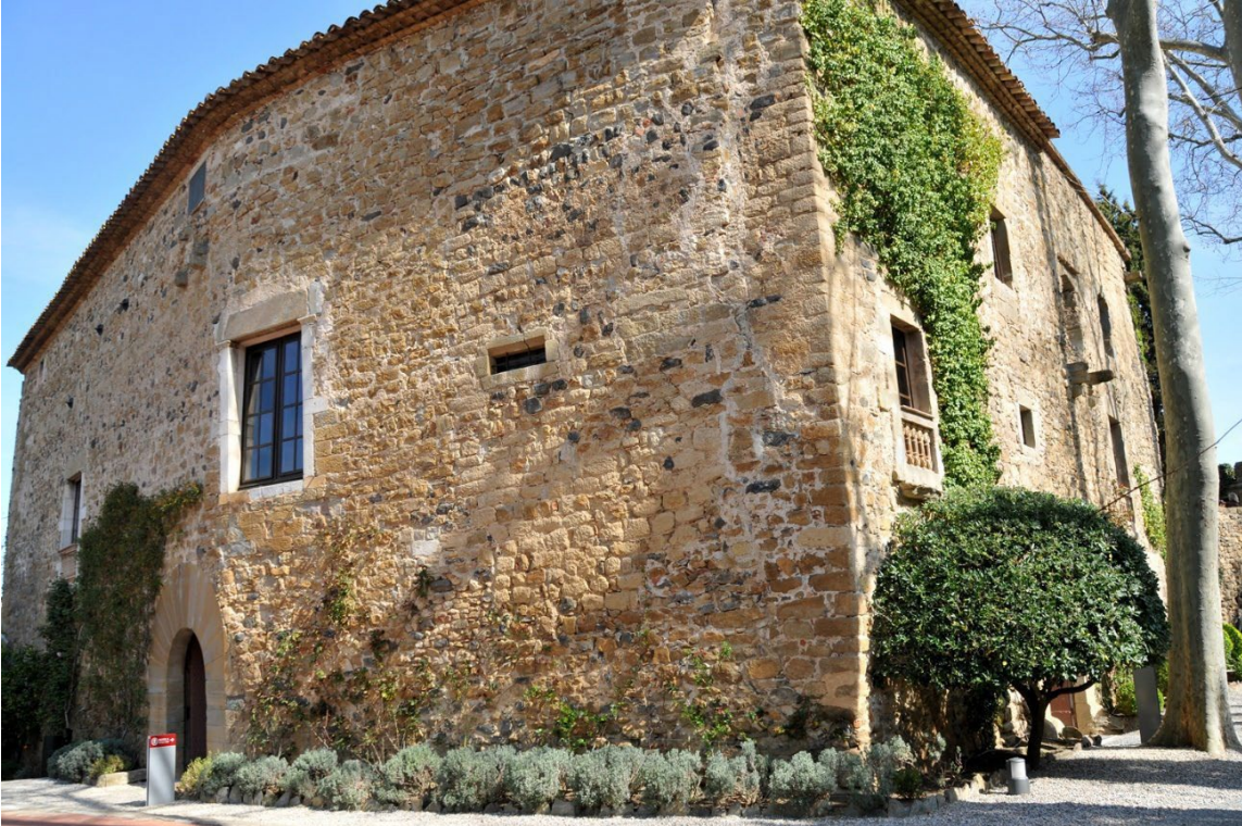
Château Gala Dalí, Púbol