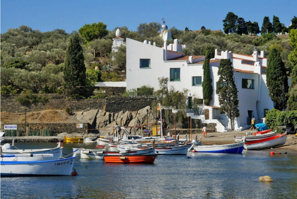
Maison-musée Salvador Dalí, baie de Portlligat