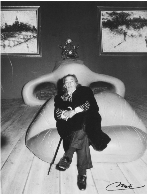
Dalí dans la Salle Mae West.