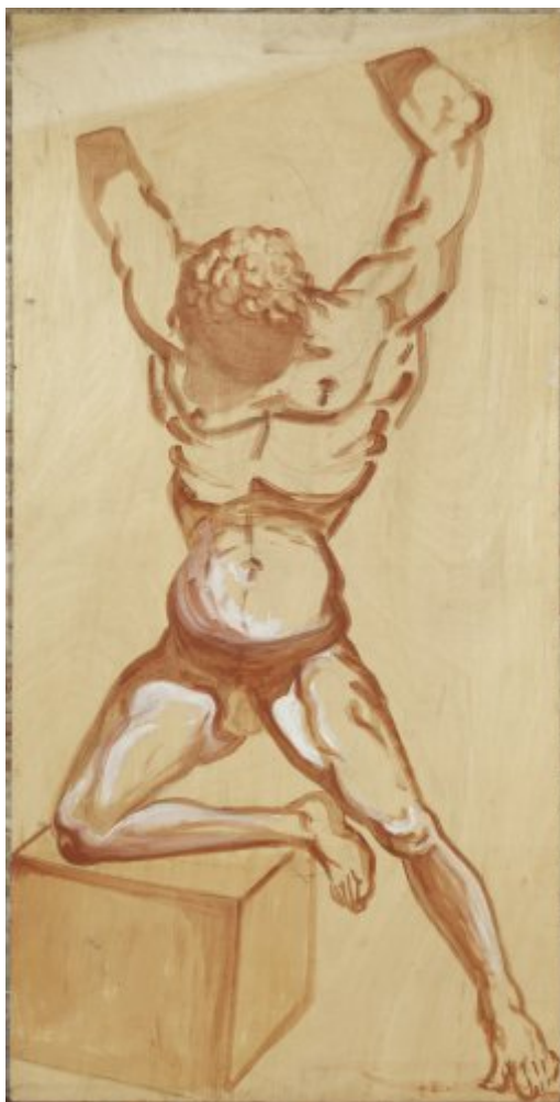
© Salvador Dalí, Fundació Gala-Salvador Dalí, Figueres, 2017