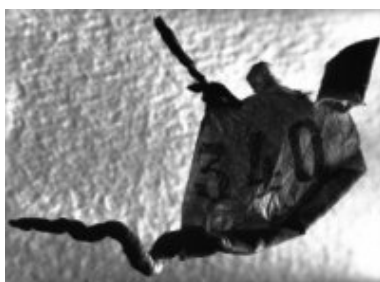
© Salvador Dalí, Fundació Gala-Salvador Dalí, VEGAP, Figueres, 2019 © Estate Brassai Succession - Philippe Ribeyrolles