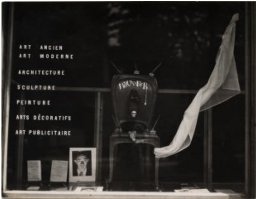
© Salvador Dalí, Fundació Gala-Salvador Dalí, VEGAP, Figueres, 2019 © Man Ray Trust, VEGAP, Girona, 2019