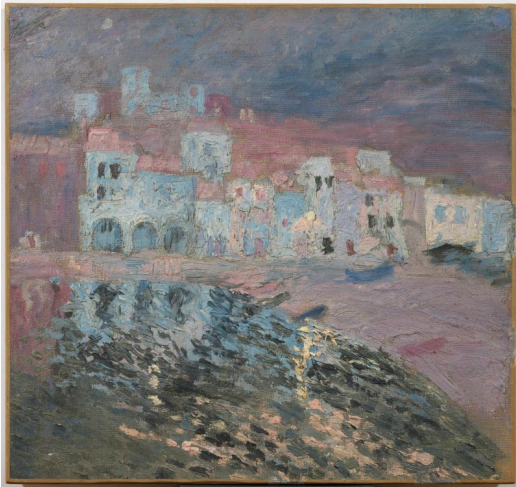
Paisatge de Cadaqués. Port Alguer