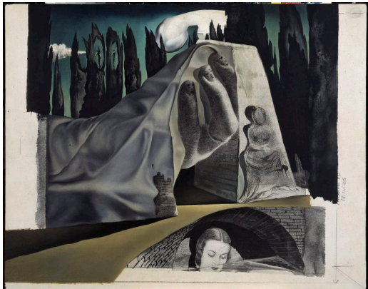
Projecte per a "Destino"

Pintura per a un dels telons del ballet Tristany i Isolda basat en l'obra homònima de Richard Wagner. Dalí el descrivia com el primer ballet paranoic inspirat en el mite etern d'amor i mort