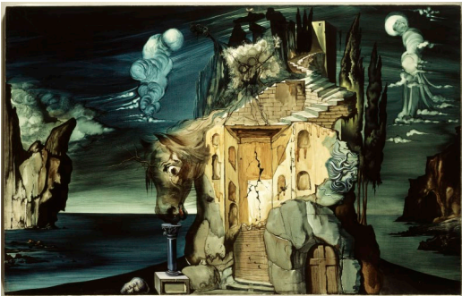
Projecte per a Tristany foll

Dibuix inspirat en el mite del Minotaure i el laberint, amb influència picassiana