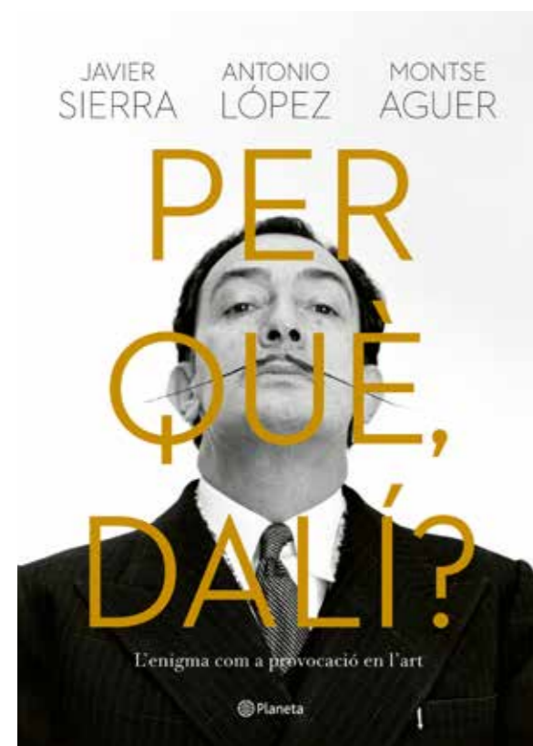
Coberta del llibre Per què, Dalí? editat per Planeta i la Fundació Dalí