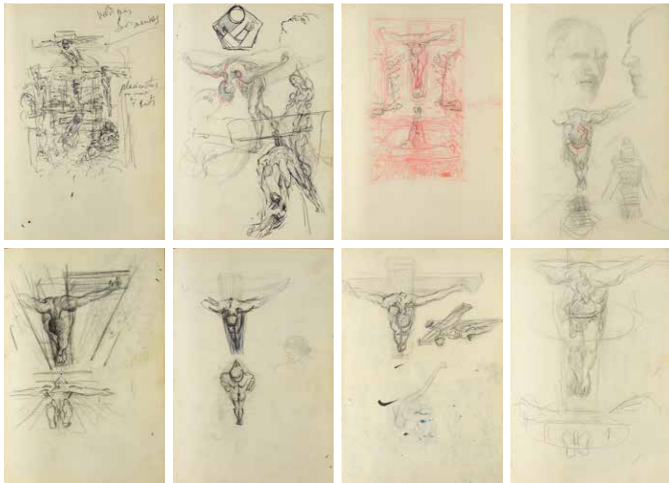
Algunes de les pàgines del quadern inèdit de l'arxiu Pere Vehí

Aquesta exposició mostra un quadern de dibuixos inèdit procedent de l'Arxiu Pere Vehí, Cadaqués. Aporta una informació valuosa sobre el procés d'elaboració de diverses obres, entre les quals hi ha no tan sols El Crist sinó també Cristòfol Colom (1958) o El sagrament del Sant Sopar (1955), a més de projectes com el guió gràfic per al film no realitzat L'ànima (1948-1952). Això permet datar la llibreta als inicis de l'etapa mística nuclear, entre els anys 1948 i 1958. S'hi observa un artista que assaja diverses formes, disposicions d'elements, perspectives i composicions —algunes de les quals recorden la figura esbossada pel místic sant Joan de la Creu—, fins a trobar la més convincent.