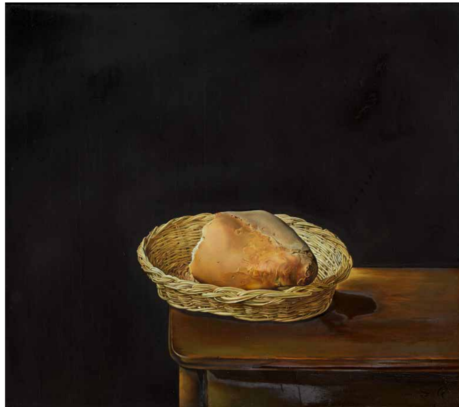
Salvador Dalí. La cistella de pa , 1945. Oli sobre tauler de fusta contraplacat 33 x 38 cm © Salvador Dalí, Fundació Gala-Salvador Dalí, Figueres/VEGAP, 2023

Forma part de l'exposició material inèdit que permet conèixer el context de creació d' El Crist : cinc fotografies, sis peces de material preparatori i un quadern amb estudis i esbossos executats entre els anys 1948 i 1958. Aquesta llibreta es mostra en format original i amb el suport d'un monitor. Destaquen també dos audiovisuals d'uns 6 minuts de durada que posen el focus en la rellevància del context, procés de creació i del paisatge.