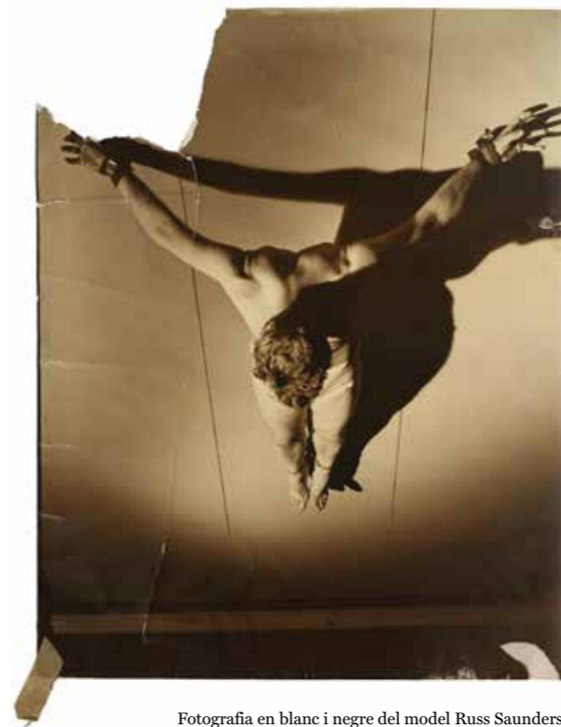
Fotografia en blanc i negre del model Russ Saunders