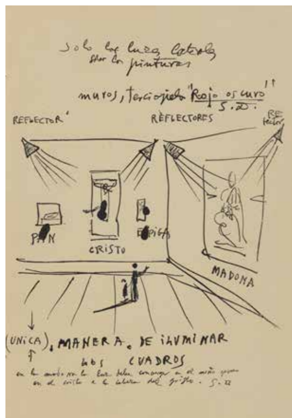
Carta de Salvador Dalí amb instruccions sobre el muntatge a la I Bienal Hispanoamericana de Arte, 1952. L'artista acompanya El Crist de La cistella de pa (1945), L'espiga Sant Jordi, el que mata dracs ( L'espiga de blat , 1947) i La Madona de Portlligat (c. 1950)