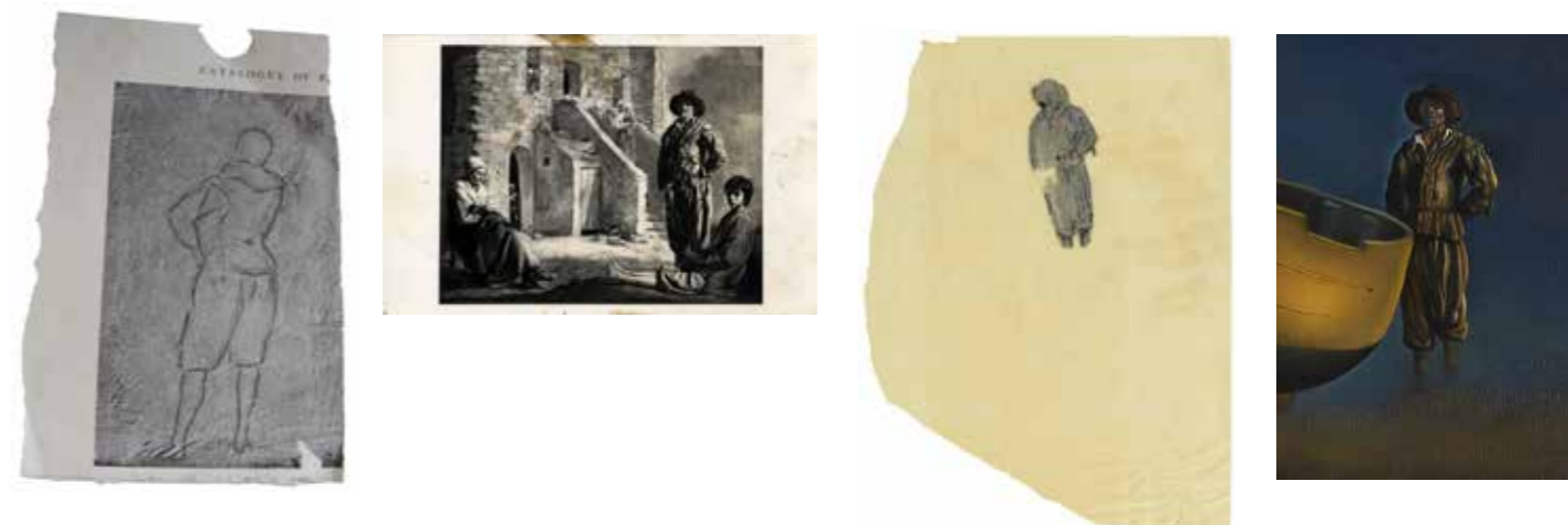
Full de llibre amb la reproducció del dibuix de Velázquez resseguit amb llapis Model per a pescador. Postal de Paysans devant leur Maison , Louis Le Nain (c. 1641-1642) Calc a tinta negra d'una figura de la pintura de Louis Le Nain, Paysans devant leur maison , de 1641 Detall de la segona figura del pescador de l'obra El Crist , 1951. © Salvador Dalí, Fundació Gala-Salvador Dalí, Figueres /VEGAP, 2023

Dalí sol utilitzar com a models objectes i persones molt propers, físicament i afectivament. Així, en algunes de les seves obres reconeixem personatges de Cadaqués, sovint pescadors. En el cas d' El Crist , el paisatge es completa amb una escena habitual a la badia: uns pescadors feinejant a la riba. Ara bé, per a aquesta tela, Dalí imagina unes figures d'ascendència molt concreta: «També havia tingut d'entrada la temptació de prendre com a model, per al fons, els pescadors de Portlligat, però en aquest somni, en el lloc dels pescadors de Portlligat, apareixia, en un vaixell, un personatge de pagès francès pintat per Le Nain, del qual només el rostre havia canviat per assemblar-se a un pescador de Portlligat. El pescador, vist d'esquena, tenia, però, una silueta a l'estil de Velázquez».