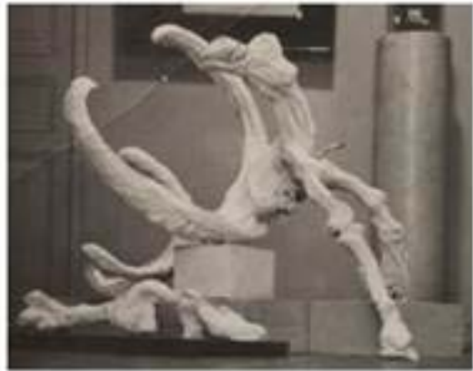
Núm. Cat. OE 18 Espectre ornamental de l'erecció, 1933-1934