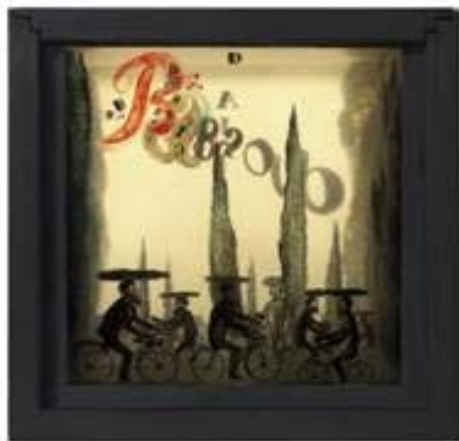
Núm. Cat OE 2 Babaouo, 1932

És molt significatiu el diàleg que Dalí estableix en algunes ocasions entre la pintura i l'obra tridimensional, com passa en Babaouo del 1932. Es tracta en realitat d'una caixa de fusta, a l'interior de la qual hi ha set làmines de vidre pintades per Dalí, col·locades una darrera l'altre i retro-il·luminades. Està relacionada amb el guió d'una pel·lícula –no realitzada a l'època– que Dalí va escriure i publicar en format de llibre. És molt probable que aquest objecte pretengués servir per la promoció d'aquell llibre. En aquest cas concret, Dalí vol dotar la pintura d'una dimensió tridimensional a través d'un joc d'efectes òptics potenciats per la pròpia il·luminació de la peça. El mateix es pot apreciar en El petit teatre conservat al MoMA de Nova York, on es descobreix un veritable compendi de la iconografia surrealista de Dalí.