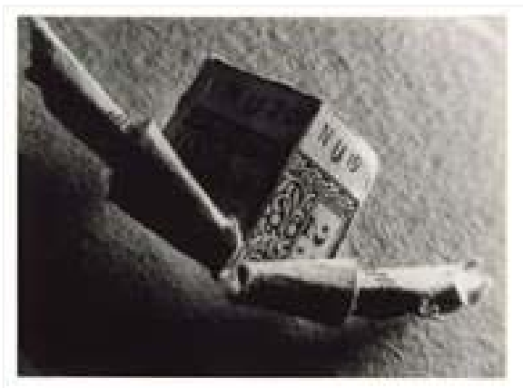
Núm. Cat OE 3 Bitllet d'autobús enrotllat «simètricament», una forma molt rara d'automatisme morfològic amb gèrmens evidents d'estereotípia, 1932-1933

A més, s'ha identificat i catalogat un procés creatiu que defineix la creació escultòrica de Dalí: l'obra original única amb versions, que es pot il·lustrar a través del Bust de dona retrospectiu del 1933, conservat al MoMA de Nova York. Després de la primera presentació d'aquesta obra l'any 1933, Dalí la modifica afegint o substituint alguns elements principals. Entre 1934 i 1939 s'han documentat quatre ocasions en què Dalí transforma i presenta aquesta obra, i en algunes ocasions li atorga, fins i tot, títols diferents. Aquest procés de creació determina que cada versió tingui una "vida" limitada, i s'hagin de definir per tant com a obres efímeres.