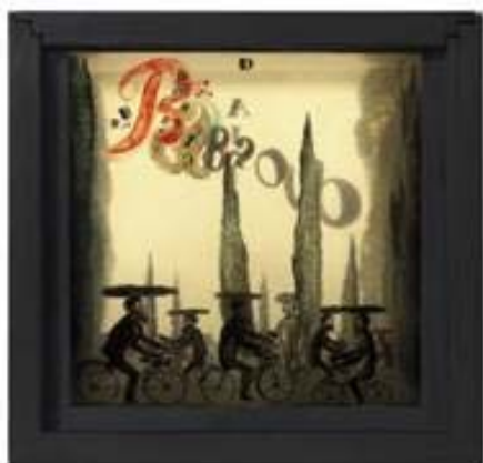
Núm. Cat OE 2 Babaouo, 1932

Es muy significativo el diálogo que Dalí establece en algunas ocasiones entre la pintura y la obra tridimensional, como ocurre en Babaouo del 1932. Se trata en realidad de una caja de madera, en cuyo interior hay siete láminas de cristal pintadas por Dalí, colocadas una tras otra y retroiluminadas. Está relacionada con el guion de una película –no realizada en la época– que Dalí escribió y publicó en formato libro. Es muy probable que este objeto pretendiera servir para la promoción de aquel libro. En este caso concreto, Dalí quiere dotar a la pintura de una dimensión tridimensional a través de un juego de efectos ópticos potenciados por la iluminación de la pieza. Lo mismo puede apreciarse en El pequeño teatro conservado en el MoMA de Nueva York, donde se descubre un verdadero compendio de su iconografía surrealista.