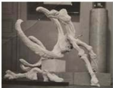
Núm. Cat. OE 18. Espectro ornamental de la erección, 1933-1934