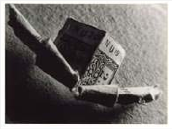
Núm. Cat OE 3 Billete de autobús enrollado «simétricamente», una forma muy rara de automatismo morfológico con gérmenes evidentes de estereotipia, 1932-1933 © Salvador Dalí, Fundació Gala-Salvador Dalí, VEGAP, Figueres, 2019

Además, se ha identificado y catalogado un proceso creativo que define la creación escultórica de Dalí: la obra original única con versiones, que puede ilustrarse a través del Busto de mujer retrospectivo de 1933 (MoMA, Nueva York). Después de la primera presentación de esta obra en 1933, Dalí la modifica añadiendo o sustituyendo algunos elementos principales. Entre 1934 y 1939 se han documentado cuatro ocasiones en las que Dalí transforma y presenta esta obra y, en algunas ocasiones le otorga, incluso, títulos diferentes. Este proceso de creación determina que cada versión tenga una “vida” limitada, y deban definirse, por tanto, como obras efímeras.