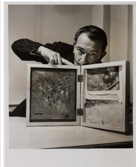
Marta Holmes Salvador Dalí amb l'oli La servent dels deixebles d'Emmaús i material de taller, c. 1960.

© Les Films de l'Équinoxe - fonds photographique Denise Bellon. Drets d'imatge de Salvador Dalí reservats. Fundació Gala-Salvador Dalí, Figueres, 2018