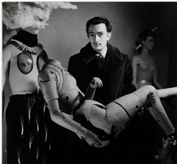
Denise Bellon Salvador Dalí i el seu maniquí a l' Exposition Internationale du Surréalisme , París, 1938.

Drets d'imatge de Salvador Dalí reservats. Fundació Gala-Salvador Dalí, Figueres, 2018