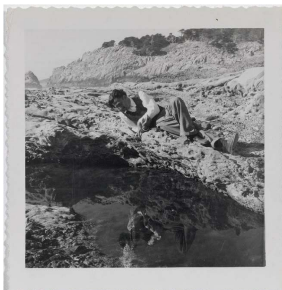
Salvador Dalí a la Punta dels Tres Frares a Cala Galladera, Cap de Creus. c. 1948