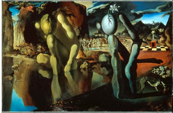
Metamorfoosi de Narcís , 1937 Tate Modern, Londres © Salvador Dalí, Fundació Gala-Salvador Dalí, Figueres, 2019