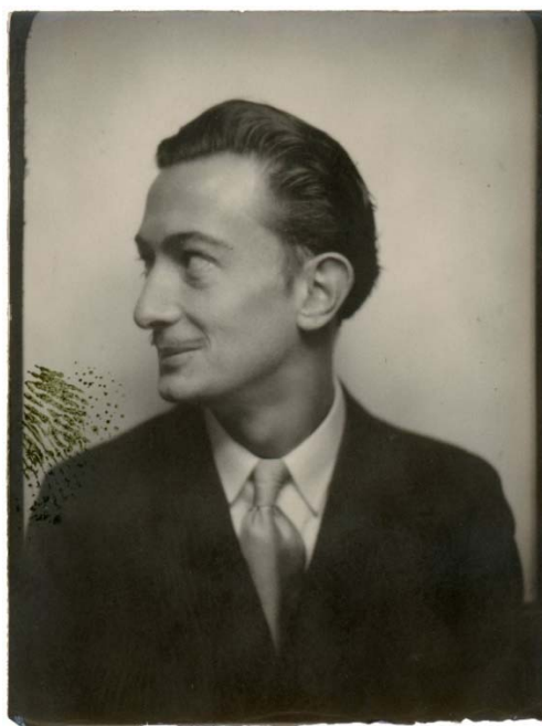
* Autoretrats de Gala i Salvador Dalí a un photomaton, c. 1929