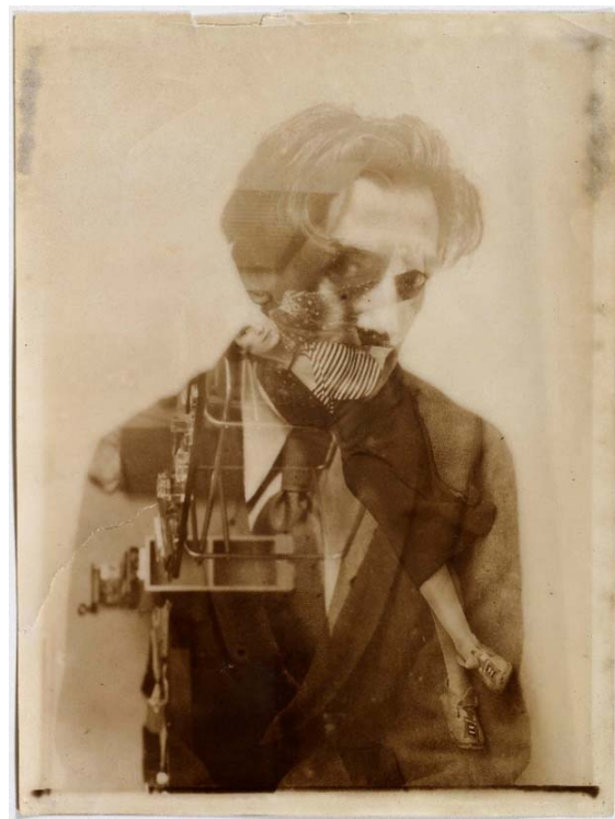
Sobreimpressió de Gala i Salvador Dalí, 1935-1937