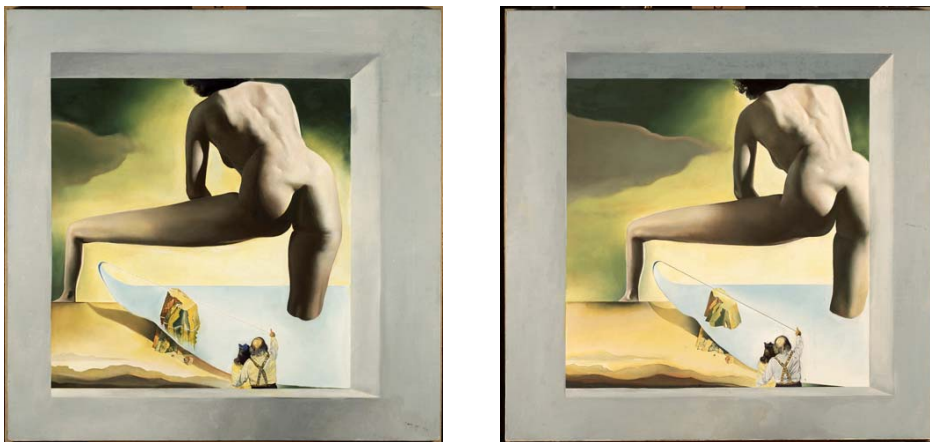
Dalí levantando la piel del mar Mediterráneo para enseñar a Gala el nacimiento de Venus . Obra estereoscópica. 1978

Pero, ¿qué es la estereoscopía? Es el resultado de la visión de dos imágenes planas de un mismo objeto, tomadas desde puntos de vista distintos. Cuando cada ojo mira una de las imágenes, el cerebro las suma y se produce la sensación de profundidad. A partir de este principio, Dalí realiza pares de pinturas, donde representa una imagen de manera casi idéntica, pero desde puntos focales divergentes, para producir efectos de tercera dimensión en la mirada de los espectadores. Para conseguir un efecto de relieve perfecto, Dalí desplaza ligeramente el centro de cada una de las imágenes en relación a los ojos del espectador; nunca se trata, por tanto, de dos copias idénticas. De hecho, los colores de las imágenes también cambian, a veces, de forma bastante evidente. La composición resultante se forma en nuestro cerebro, con la virtud de ser una imagen en tres dimensiones, como las que hoy han popularizado los juegos y las proyecciones virtuales.